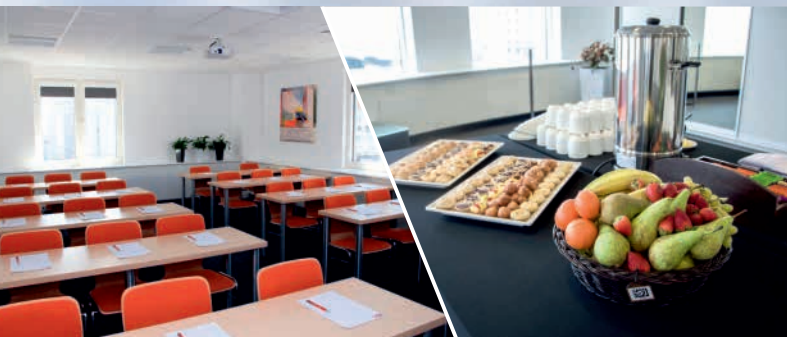
WARSZAWA (Centrum) Centrum Konferencyjne ADN, Al. Jana Pawła II 25