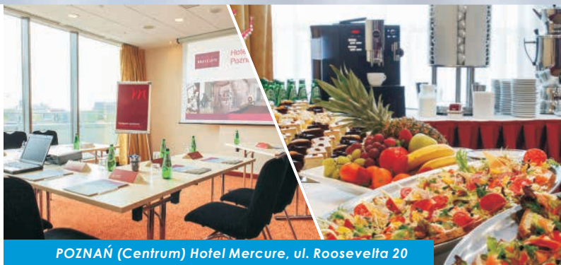
POZNAŃ (Centrum) Hotel Mercure, ul. Roosevelta 20